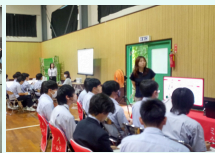
三木東高校での開催時の様子 大岡学園での開催時の様子